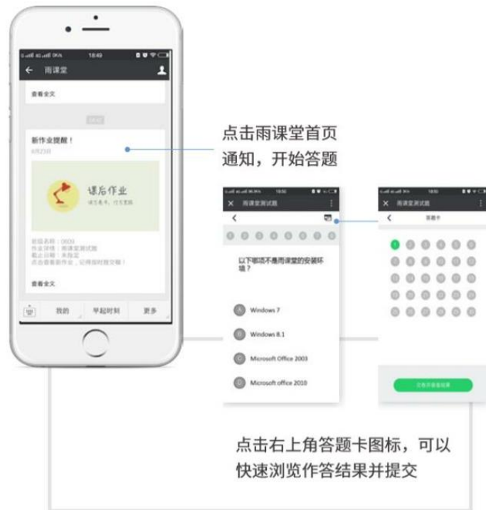
图 16 作业提醒