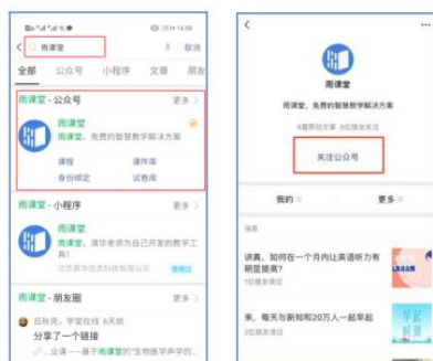
图 1 关注“雨课堂”