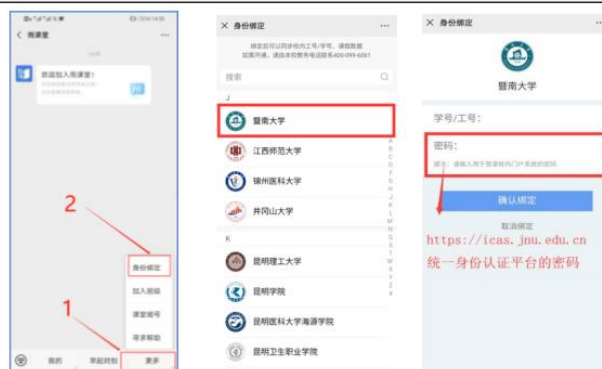
图 2 身份绑定