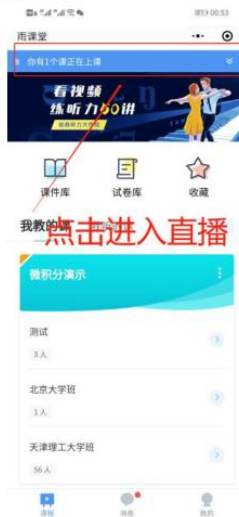
图 5 小程序进入直播界面

进入雨课堂小程序后，在小程序上方若发现有“你有 1 个课正在上课”的提示，点击该提示即可进入直播。如图 5 所示。