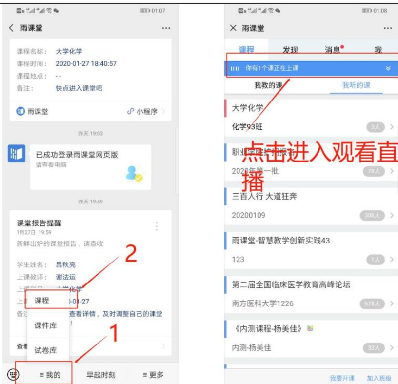
图 6 公众号进入直播

(4) 通过浏览器进入观看直播（推荐用 Chrome、火狐、360 浏览器等） 通过浏览器进入雨课堂网页版 ( http://yuketang.cn ) ,点击右上角【登录网页版】， 如图 7 所示。之后用绑定了账号的微信扫码进入课程观看页面。