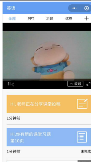
图 9 学生手机端直播预览效果