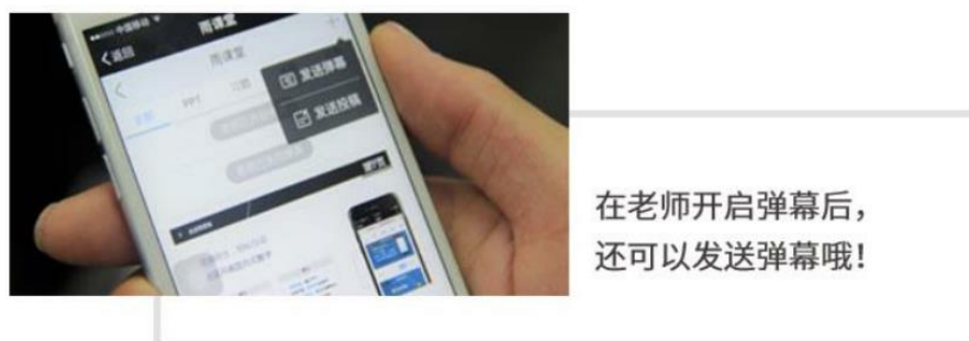
图 13 弹幕投稿操作

点击手机屏幕右上角的【+】，选择【发送投稿】，就可以随时发送图文消息给老师，如图 13 所示。