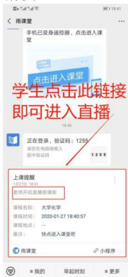
图 3 学生接收上课直播提醒

(1) 教师可在开启直播时给学生发送通知，学生可在微信公众号里收到直播提醒，点击此消息即可进入直播。如图 3 所示。