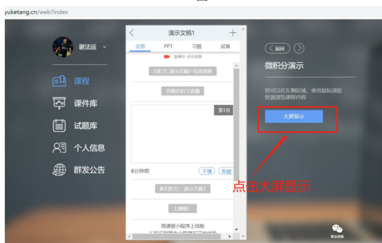
图 9 可进入大屏显示