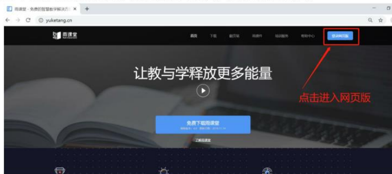
图 7 雨课堂网页版登录界面

(4) 通过浏览器进入观看直播（推荐用 Chrome、火狐、360 浏览器等） 通过浏览器进入雨课堂网页版 ( http://yuketang.cn ) ,点击右上角【登录网页版】， 如图 7 所示。之后用绑定了账号的微信扫码进入课程观看页面。