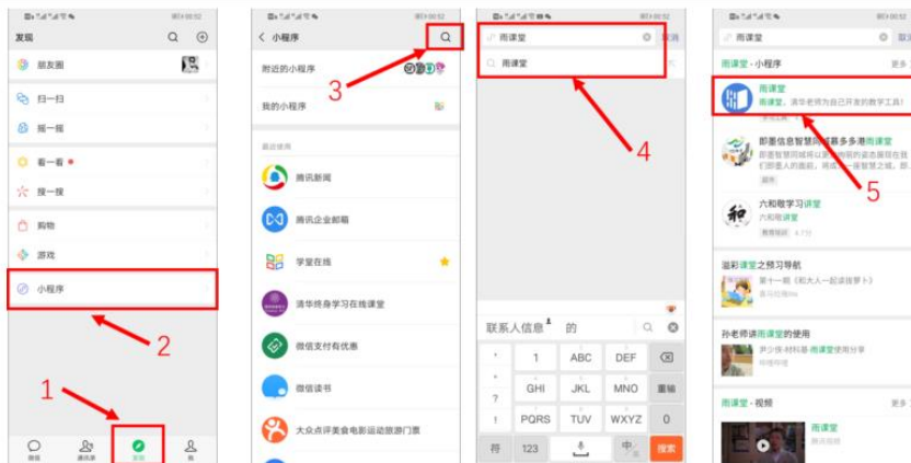
图 4 搜索进入雨课堂小程序

进入雨课堂小程序后，在小程序上方若发现有“你有 1 个课正在上课”的提示，点击该提示即可进入直播。如图 5 所示。