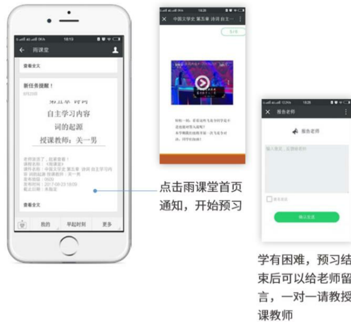
图 15 接收预习任务并完成预习

若老师给学生推送了预习资料，各位同学将在雨课堂公众号里收到相应的通知提醒，点击该提醒即可启动预习，预习之后带着思考去上课。（ 温馨提示：请在老师规定时间内完成预习。老师能看到你什么时候完成预习，预习了哪几页等信息 ）